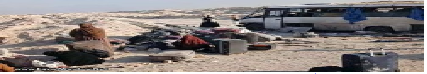
بالصور: إصابة 18 طالبة في حادث أتوبس بطريق الصعيد الحر بالمنيا الخميس 9 أبريل 2026 11:20 م