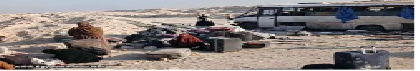
بالصور: إصابة 18 طالبة في حادث أنوبس بطريق الصعيد الحر بالمنيا الخميس 9 أبريل 2026 11:20 م