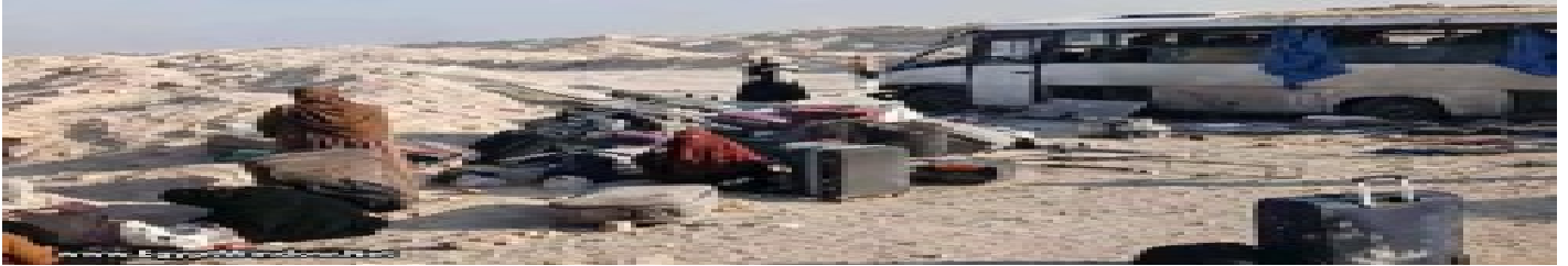
بالصور: إصابة 18 طالبة في حادث أتوبس بطريق الصعيد الحر بالمنيا الخميس 9 أبريل 2026 11:20 م